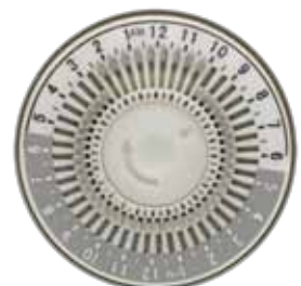
Figure 1 - Illustre le réglage de la minuterie pour mettre en marche l'appareil à 22 h (10 PM) et l'arrêter à 2 h (2 AM). Remarquez que TOUS les segments entre 10 PM et 2 AM ont été réglés. L'heure actuelle est 20 h (8:00 PM).

NOTA : Pour annuler les réglages de la minuterie et utiliser l'interrupteur normalement, réglez l'interrupteur de la minuterie à la position « ON » (marche). Cela désactive la commande des lumières de la minuterie, mais le cadran de la minuterie affichera toujours l'heure actuelle de la journée. Pour réactiver la commande des lumières de la minuterie, réglez l'interrupteur de la minuterie à la position « TIMER » (minuterie). En cas de panne de courant, réinitialisez l'heure du jour comme l'explique l'étape 1.