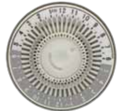
Figure 1 - shows timer set to turn appliance ON at 10 PM and OFF at 2 AM. Notice ALL segments between 10 PM and 2 AM have been pushed out. Current time is 8:00 PM.